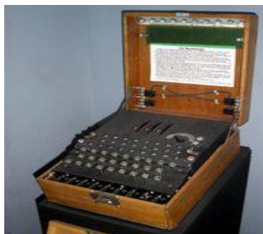
Figura 1 –Máquina Enigma, utilizada na cifragem e decifragem de mensagens secretas.

Estuda os princípios e técnicas pelas quais a informação pode ser transformada da sua forma original para outra ilegível, de forma que possa ser conhecida apenas por seu destinatário (detentor da "chave secreta"), o que a torna difícil de ser lida por alguém não autorizado. Assim sendo, só o receptor da mensagem pode ler a informação com facilidade.