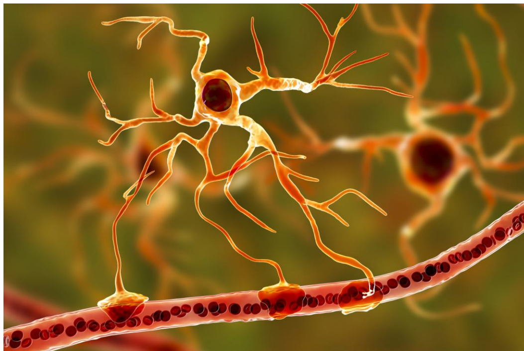
Ilustração 1 Astrócitos